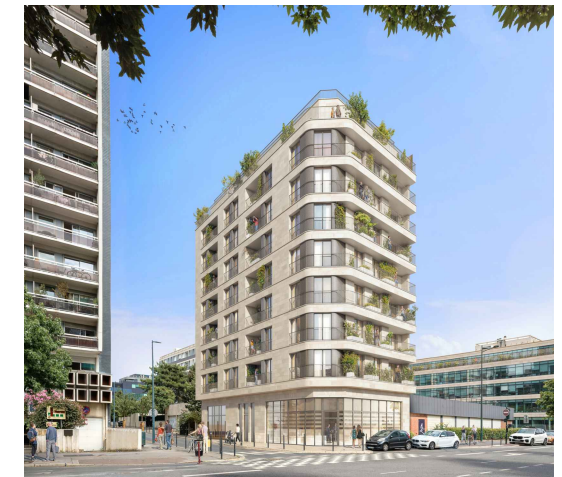
30 RUE MARTRE 92110 - CLICHY-LA-GARENNE