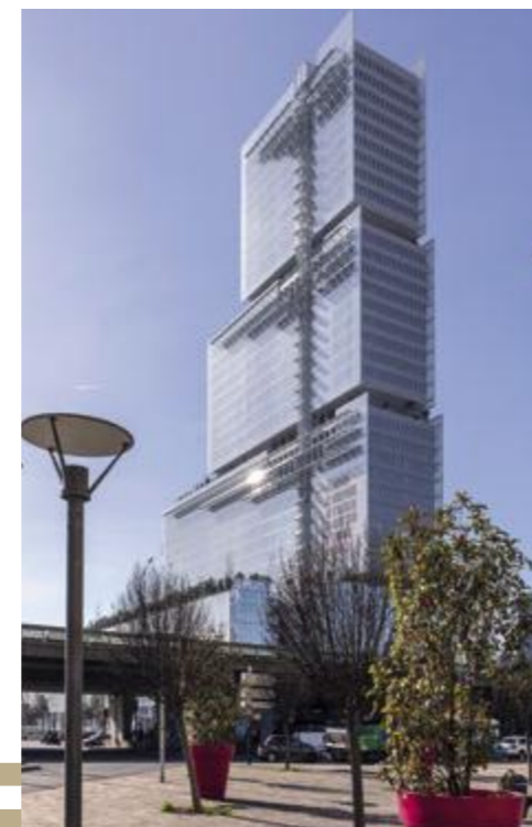
Tribunal de Paris à 10 minutes en voiture*