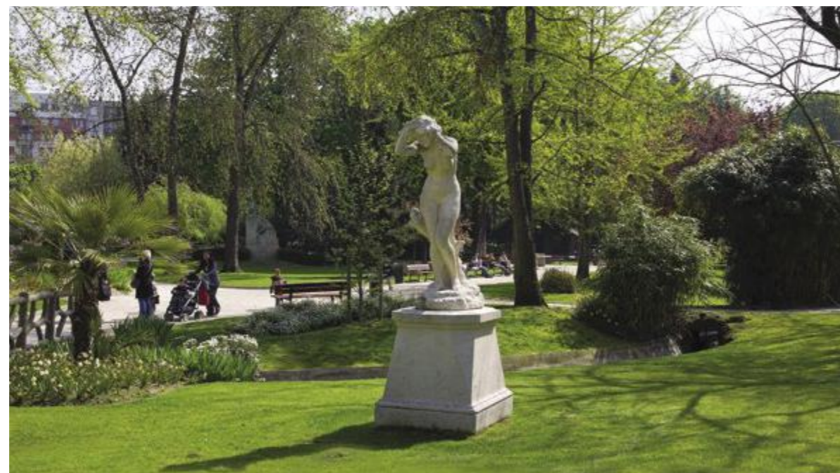
Parc Roger Salengro à 10 minutes à pied*

De l'autre côté, l'adresse se tourne vers les grands espaces et l'Île-de-France. Outre la proximité du métro ligne 13, à 400 mètres*, et de nombreuses lignes de bus, le pont de Clichy et les berges sont à deux pas. La rue Martre est également très rapidement accessible depuis la porte de Clichy. Large et arborée, agrémentée d'un agréable square en face de la résidence, elle offre un cadre de vie aéré et sans vis-à-vis.