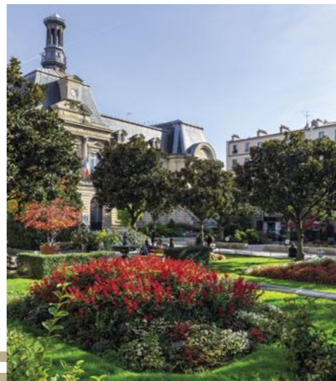
Hôtel de ville à 6 minutes à pied*